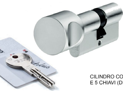
CILINDRO CON POMOLO E 5 CHIAVI (DI SERIE)